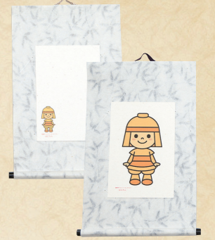
60 玄関や和室に 飾りたいミニ掛軸