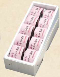
02 高槻寒天を使った一口ようかん