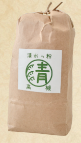
24 品質の高い 高槻清水地域産の 玄米から製粉した米粉