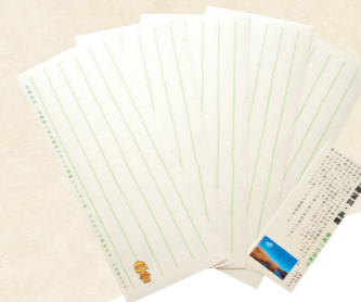
61 鶏殿のヨシで作った はにたんロゴ入り筆箋