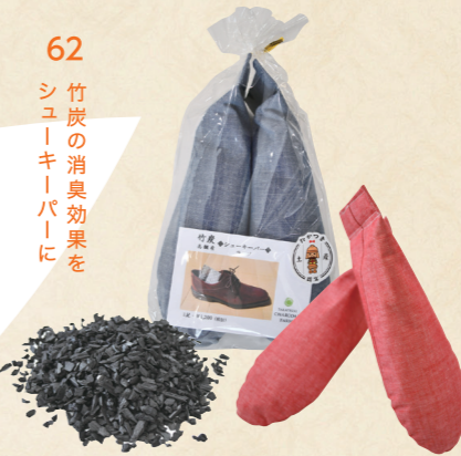
62 竹炭の消臭効果を シユーカーパーに