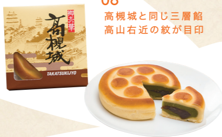
08 高槻城と同じ三層餡高山右近の紋が目印