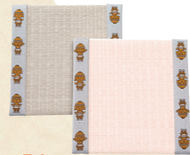
54 はにたん と畳の マウスパッド