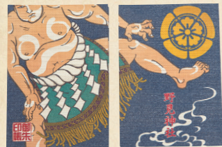
53 相撲の始祖が ご祭神 朱印帳も力士で