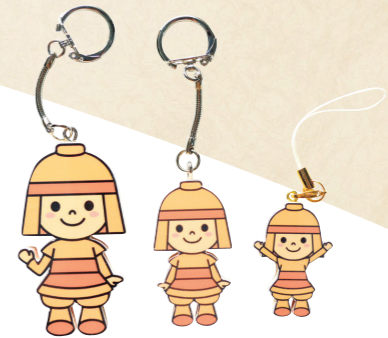
65 パターンは全部で8種類 色んな、はにたんキーホルダー