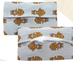
55 畳のへりで作った ポケットティッシュカパー