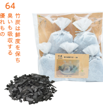
64 竹炭は鮮度を保ち 臭いも吸収する 優れたもの