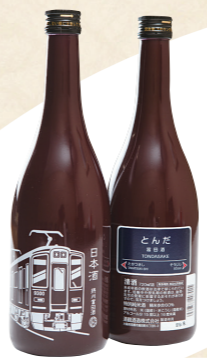
43 電車好きにも好評の 特別純米酒