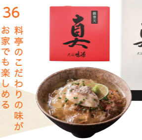
36 料理のこだわり味が お家でも楽しめる