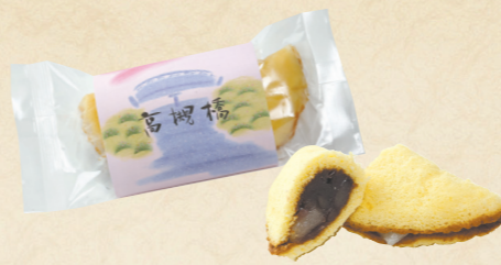
12 芥川にかかる高槻橋から命名された銘菓