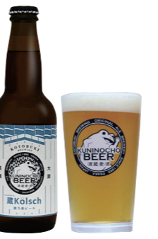
47 糠やかで上品な香り モルティな味わい