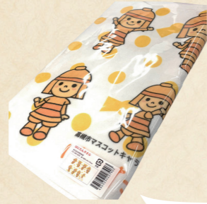
51 はにたんがかわいい フェイスタオル