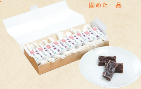
03 高槻産小豆を蜜漬けにし高槻糸寒天で固めた一品