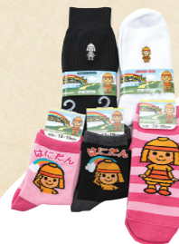
56 足元もはにたんで かわいくおしゃれに