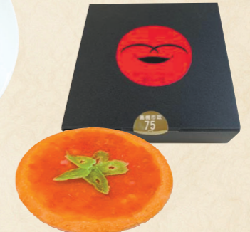
20 清鶴の酒粕×高槻産トマト新しい発想のチーズケーキ