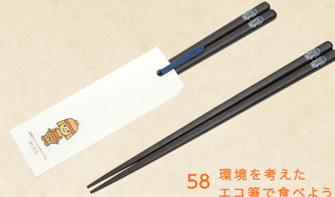
58 環境を考えた エコ箸で食べよう