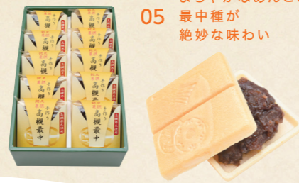
05 まるやかなあんこと最中種が絶妙な味わい