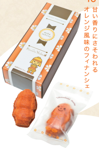
18 甘い香りにさそわれるオレンジ風味のフィナンシェ