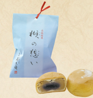
13 高槻への想いがいっぱい詰まった焼き菓子