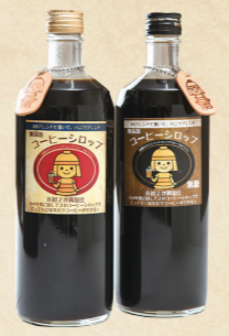
38 牛乳で割るだけで 本格カフェオレに