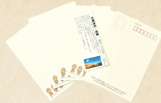
59 鶏殿のヨシで作った 和紙のハガキ