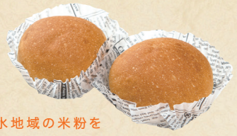
25 清水地域の米粉を 使ったロールパン