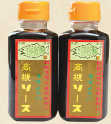
41 フライの味を 引き立てるソース