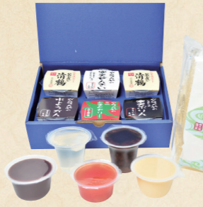
27 2種類の豆で はにたんの名前に