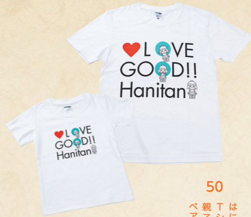
50 はにたん Tシャツ 親子で ペアルック