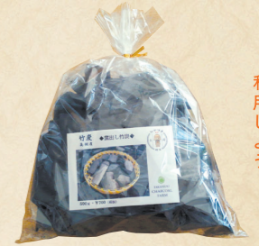
63 消臭・調湿作用に 利用しよう