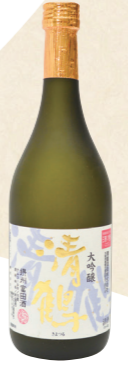
44 高槻・富田の地で 少量ながら丹精込めて手造り