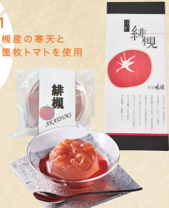
01 高槻産の寒天と三箇枚トマトを使用した