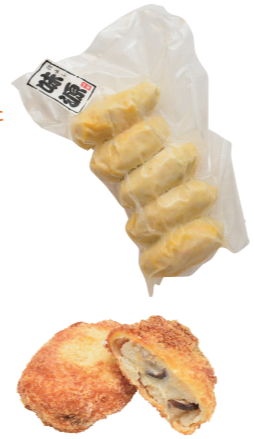
37 高槻産しいたけも入った クリーミーな鯛コロッケ