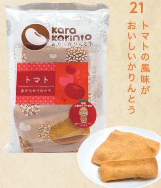
21 トマトの風味がおいしいかりんとう