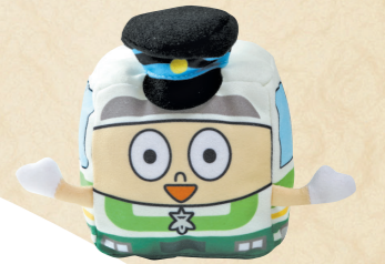
66 高槻市営バスが手のひら サイズのぬいぐるみに