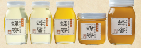
39 大阪府はちみつ品評会で 優良賞を獲得