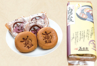
16 高槻市制50周年時に誕生した高槻太鼓