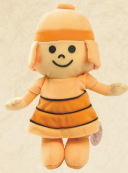
49 大好きな はにたん いつも一緒だね