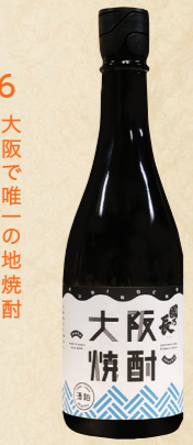
46 大阪で唯一の地焼酎 吟醸香が華やかです