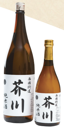
48 旧西国街道沿いの 酒屋がプロデュース