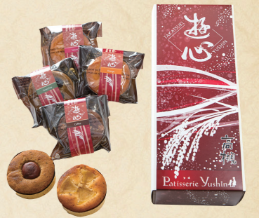
17 高槻のお米を使った全6種類の焼き菓子